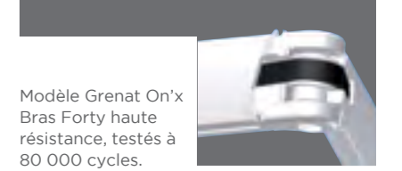
Modèle Grenat On'x Bras Forty haute résistance, testés à 80 000 cycles.