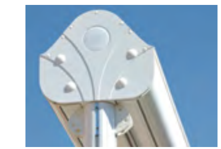
Coffre compact équipé de joues latérales en aluminium.

Coloris standards RAL 9016 - FS 7016. Autres coloris disponibles.